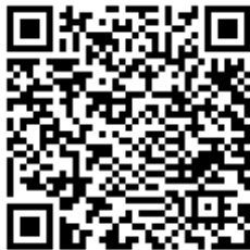
Código QR para validación en sede

Regulación CSV: Decreto 3628/2017 de 20-12-2017